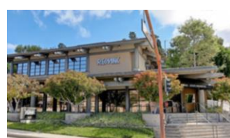
Silver Spur (Palos Verdes)