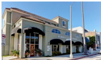
Marina del Rey

RE/MAX Estate Propertiesの支店がある主な地域 Torrance Manhattan Beach Marina del Rey Palos Verdes Hermosa Beach Santa Monica Redondo Beach Westchester West LA 他